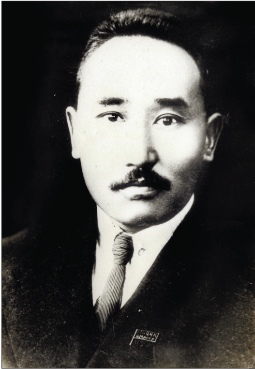
М.Н. Ербанов — Председатель Совета Народных Комиссаров БМАССР

В мае-декабре 1923 г. - председатель Бурят-Монгольского революционного комитета.