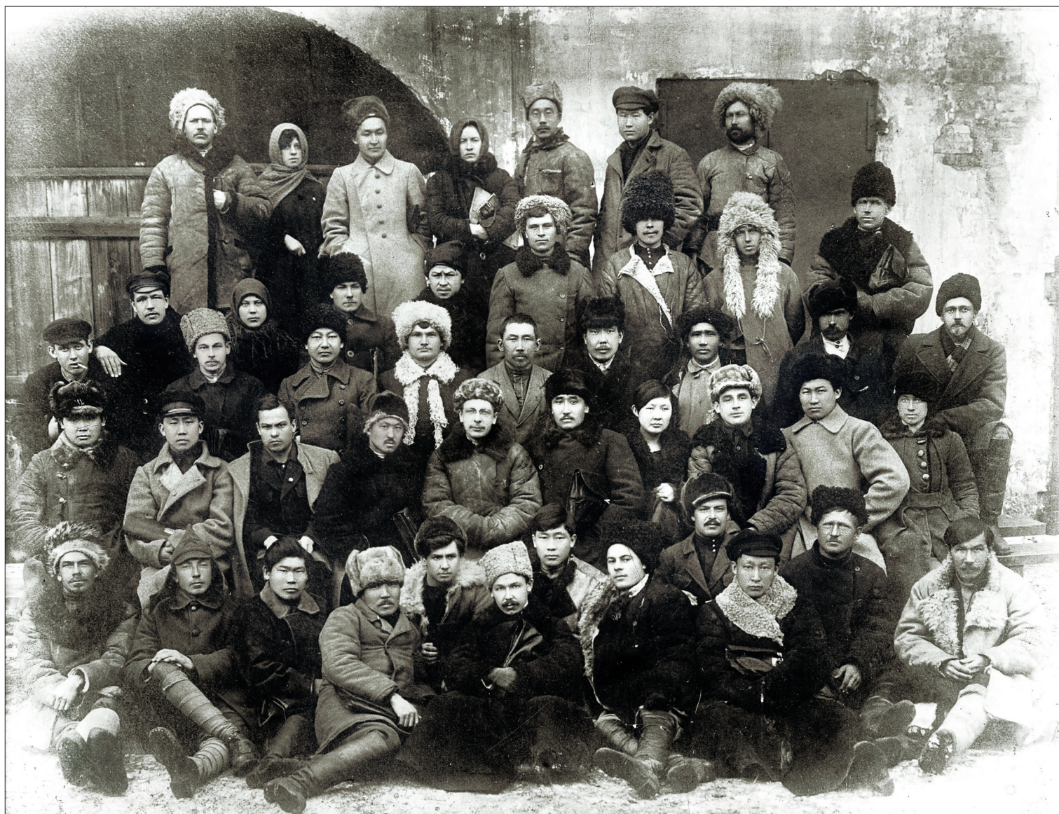
Участники партийной конференции Бурятской автономной области РСФСР, г. Иркутск. 1923 год